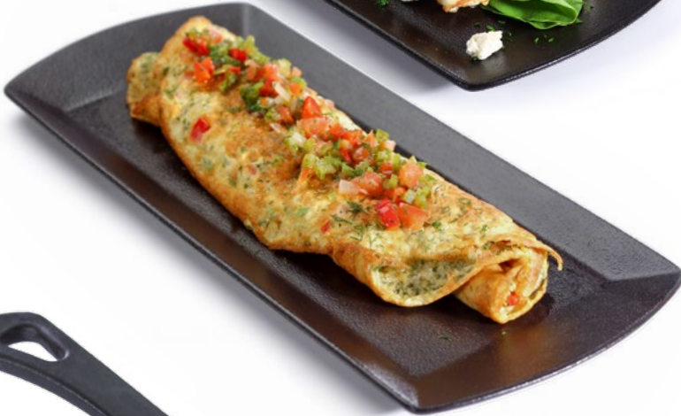
أومليت بالخضار Vegetable Omelette 1.950