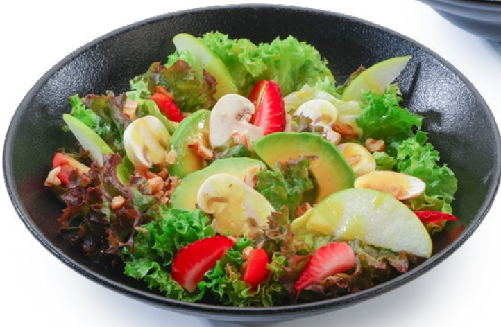
سلطة بيسترو Bistro Salad 2.250