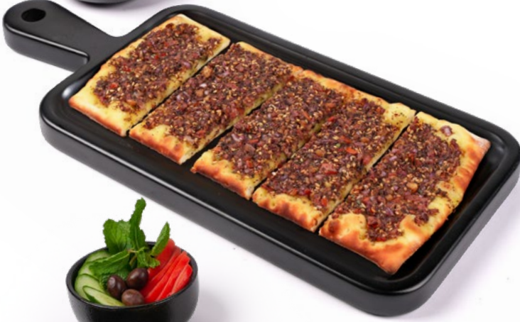
زعتار Zaatar 1.450