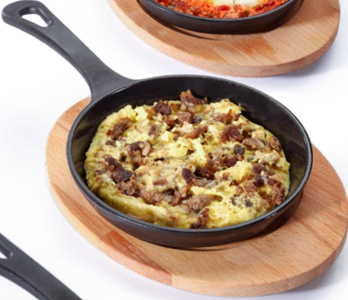
بيض بالقاورما Eggs with Awarma 2.450