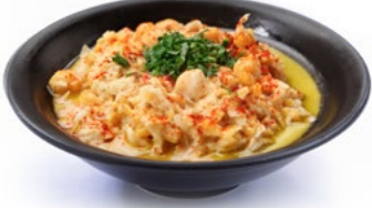
مسبحة Musabaha 1.250