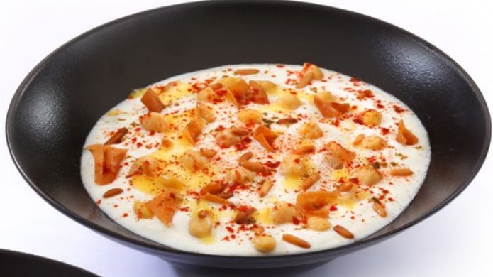
فتة فلافل Falafel Fatteh 2.750