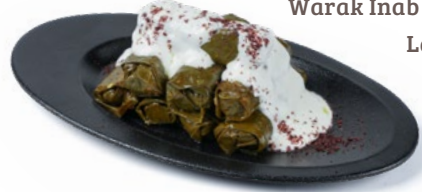
ورق عنب باللبن جديد Warak Inab with Laban 1.750