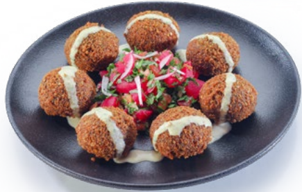
فلافل Falafel 1.250