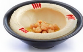
حمص Hummus 1.450