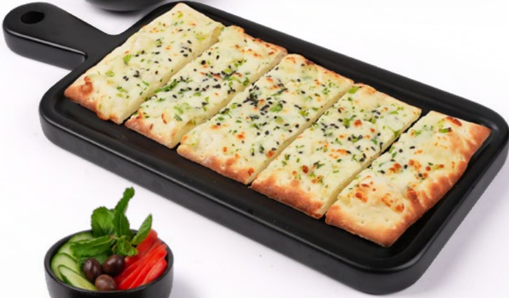
جبنة عكاوي Cheese Akawi 1.750