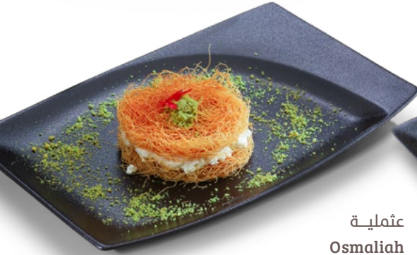
عتملية Osmaliah 1.350