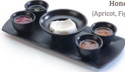
قيمر وعسل جديد مشمش، تين، فراولة Honey & Gemar (Apricot, Fig, Strawberry) 1.650