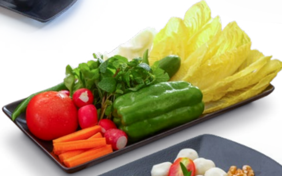
جات خضار Vegetables Platter 1.850