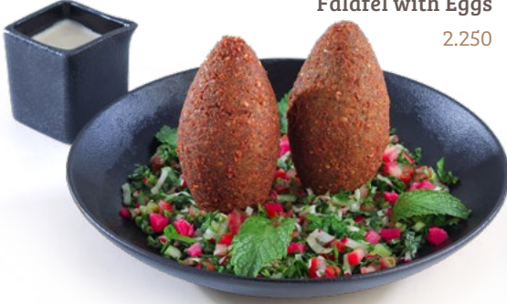
فلافل بالبيض Falafel with Eggs 2.250