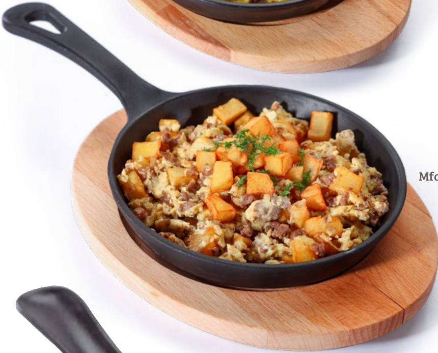
مفركة بيض مع البطاطا واللحم Mfaraket Eggs with Potato & Meat 2.450