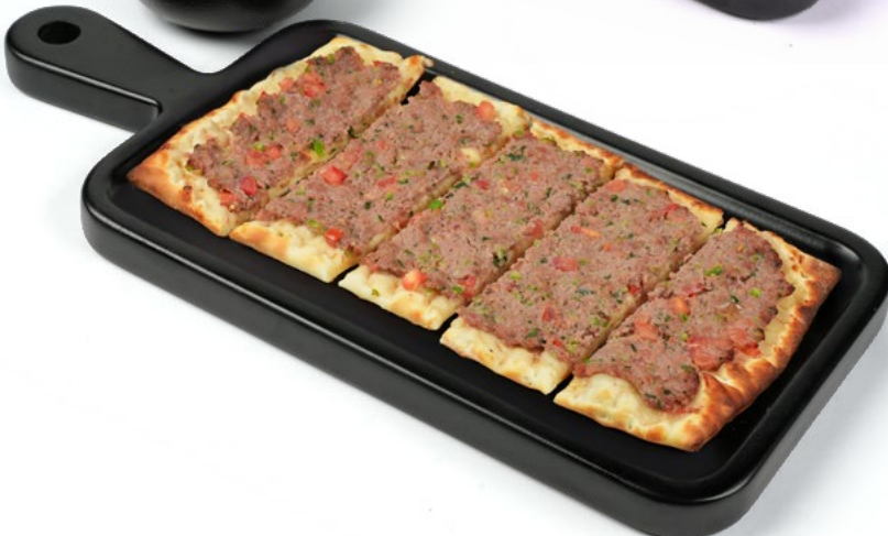
لحمة بعجين Lahme bi Ajeen 1.850