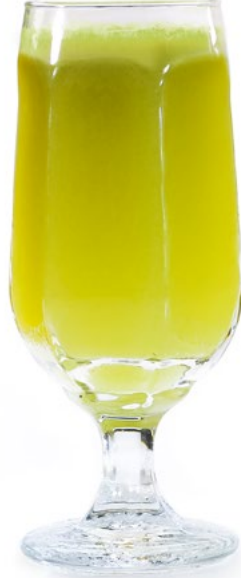
تفاح Apple 1.550