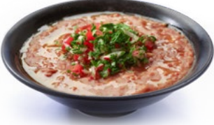
فول أبو إميل Foul Abu Emile 1.250