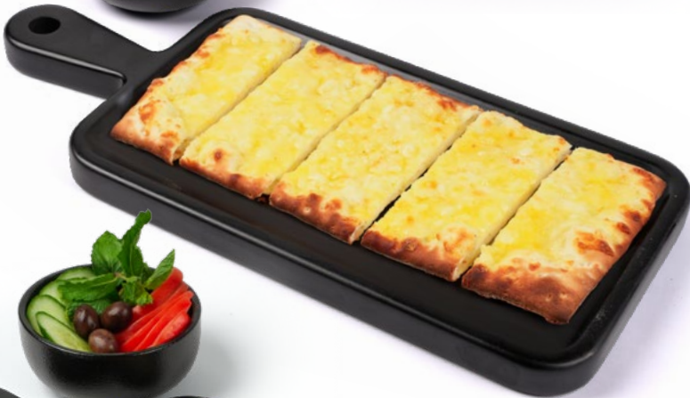
٣ أجبان 3 Cheese 1.750