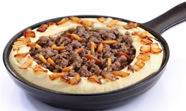
حمص بالحوسة Hummus with Minced Meat 2.450