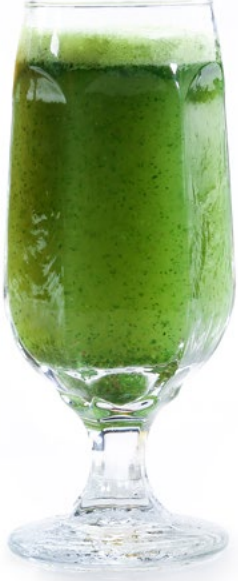
ليمون بالنعناع Lemon with Mint 1.550