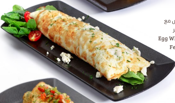
أومليت بياض البيض مع جبنة الفيتا والجرجير Egg White Omelette with Feta Cheese & Rocca 2.450