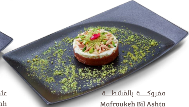
مفروكة بالقشطة Mafroukeh Bil Ashta 1.350