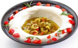
لبنة مع الزيتون الأخضر Labneh with Green Olives 1.650