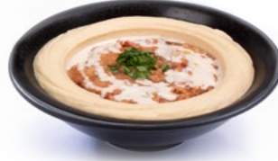
قدسية Qudsieh 1.250