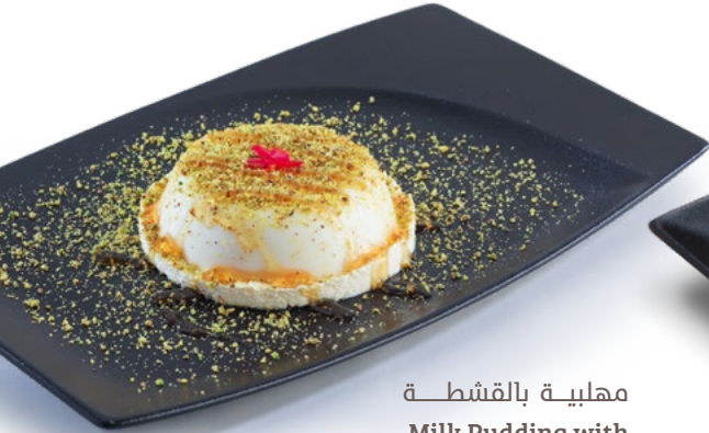
مهلبية بالقشطة Milk Pudding with Ashta & Honey 1.650