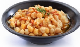
بليلة Balila 1.250