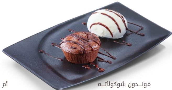
فوندون شوكولاته Chocolat Fondant 1.850