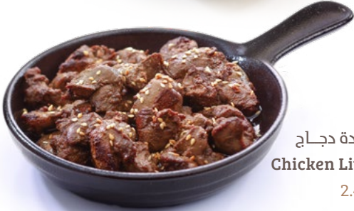
كبدة دجاج Chicken Liver 2.450