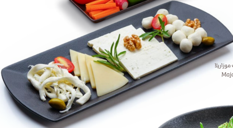
جات أجبان جديد Cheese Platter مجدولة، قشقوان، بلدي، كرات موزاريلا Majdoula, Khashaval, Baladi, Mozzarella Balls 4.250