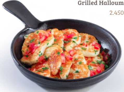
جبنة الطوم المشوية Grilled Halloum 2.450