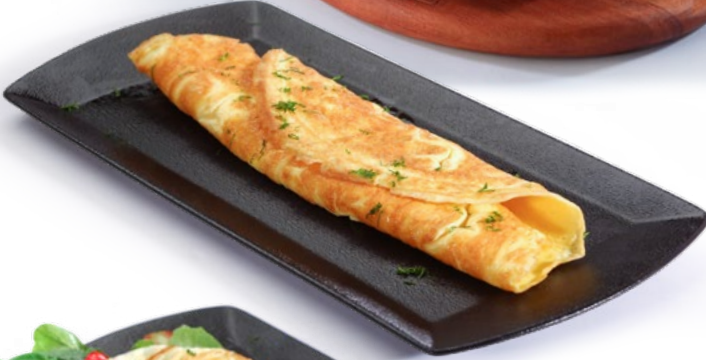
أومليت Omelette 1.950