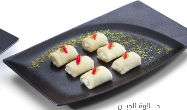
حلاوة الجبن Halawet Al Jebin 1.350