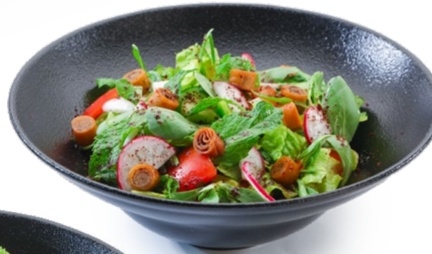
فتوش ميس Fatoush Mais 2.450