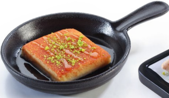
كنافة لبنانية Lebanese Kunafa 1.450