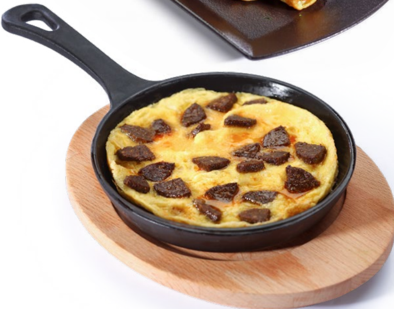
أومليت مع سجق Sujuk Omelette 2.450