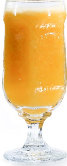
برتقال Orange 1.550