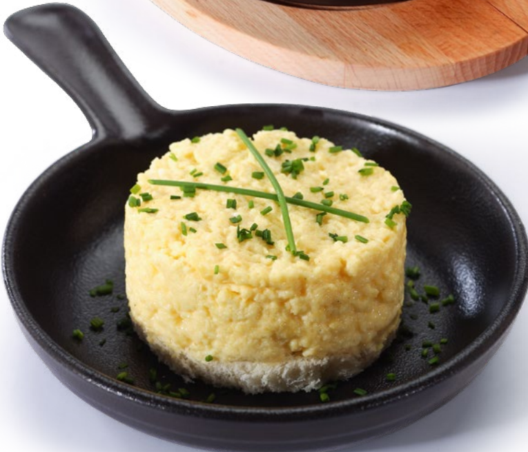
بيض مخفوق Scrambled Eggs 1.950