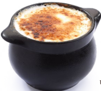
أم علي Umm Ali 1.250