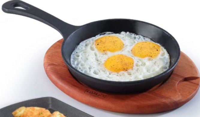
بيض عيون Sunny Side Up 1.950