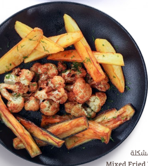
مقالبي مشكلة Mixed Fried Veggies 1.650