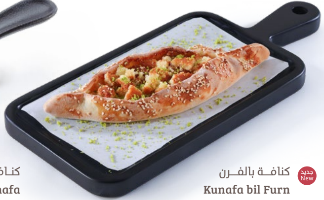
كنافة بالفرن Kunafa bil Furn 1.850