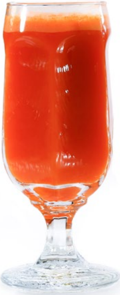
جزر Carrot 1.550